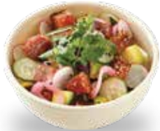
참치 포케 덮밥

칼로리 및 혈당 지수 조절에 도움을 주는 현미, 흑현미, 귀리, 퀴노아로 정성스럽게 지은 다이어트 밥을 사용합니다