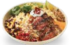
부리또 볼 (그릴 부채살)