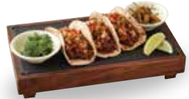
베리미트 초리조 타코