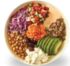
지중해식 슈퍼 샐러드