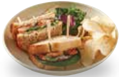
쉬림프 반미 샌드위치

혈당지수가 낮은 스펀트밀로 만든 천연 발효종 빵을 사용하여 다이어트 시 걱정 없이 드실 수 있으며, 밀가루 알러지가 있으신 분들도 안심하고 드실 수 있습니다