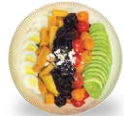
클린 콥 샐러드