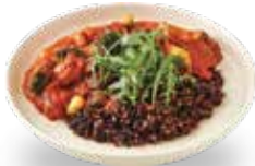
토마토 치킨 스투 라이스