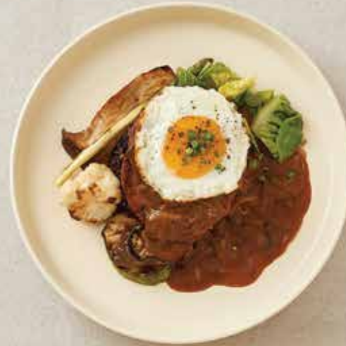
베러미트 함박 스테이크