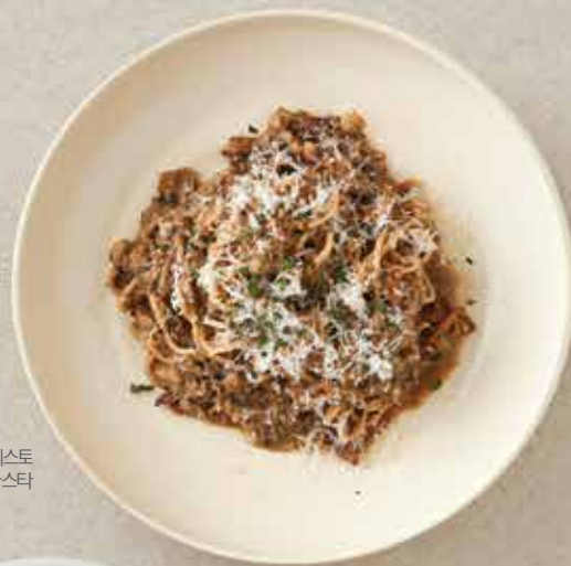
포르치니 버섯페스토 파스타

Stir-fried Squid Fried Noodles 22.0 갑오징어 야끼소바 366kcal