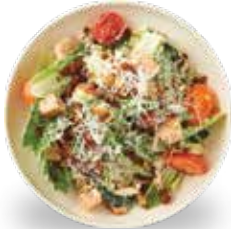
케일 시저 샐러드

최대한 자연과 가장 가까운 상태의 식재료를 사용하고, 가공 식품이나 정제된 곡물, 첨가제의 사용을 제한합니다