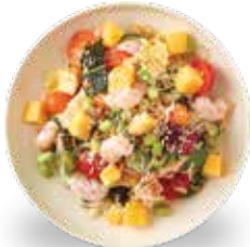
새우 타이 샐러드