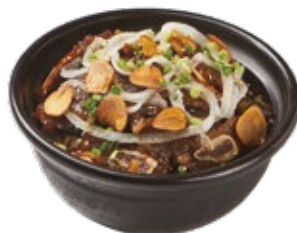
갈비 폭탄밥 Short Rib Over Rice