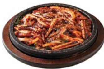
오삼불고기 Spicy Squid and Pork Belly