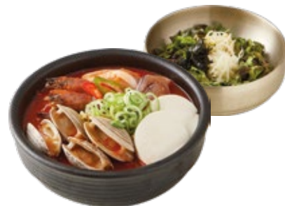
해물 순두부 정식 Soft Tofu with Seafood