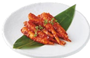
더덕 양념구이 Grilled Deodeok