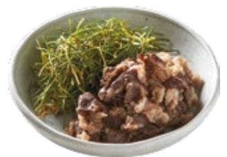
차돌구이와 영양부추 Brisket and Chive