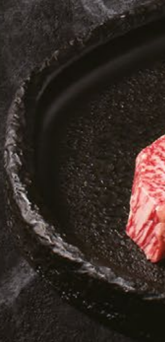
투블(BMS No.9) 숙성등심