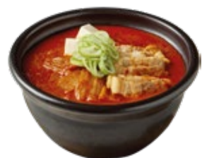
김치찌개 Kimchi Stew