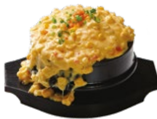
더블치즈 계란찜 Double Cheese Egg Souffle