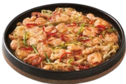
바삭 새우파전 Crispy Shrimp Pancake