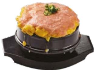
명란마요 계란찜 Fish Roe Mayo Egg Souffle