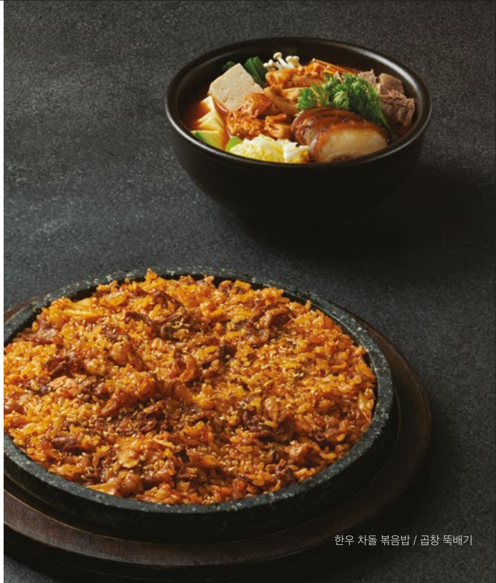
한우 차돌 볶음밥 / 곱창 뚝배기