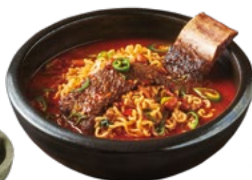
갈비 라면 Beef Short Rib Ramyeon