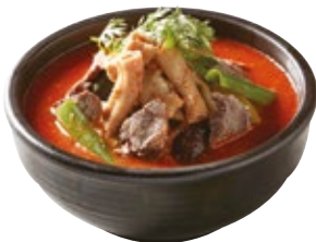
곱창 독배기 Spicy Intestine Stew