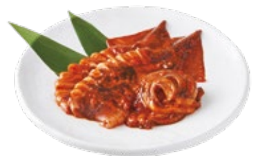
통오징어 양념구이 Spicy Whole Squid