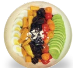
클린 콥 샐러드