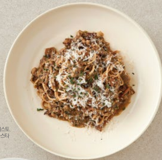
포르치니 버섯페스토 파스타

Stir-fried Squid Fried Noodles 22.0 갑오징어 야끼소바 356kcal