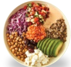
지중해식 슈퍼 샐러드

팔라펠, 단호박, 아보카도, 방울토마토, 컬리플라워, 미니양배추, 브로컬리 + 오리엔탈 드레싱 330kcal