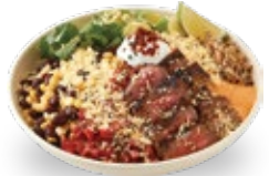
부리또 볼 (그릴 부채살)