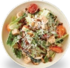
케일 시저 샐러드

최대한 자연과 가장 가까운 상태의 식재료를 사용하고, 가공 식품이나 정제된 곡물, 첨가제의 사용을 제한합니다