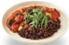
토마토 치킨 스투 라이스