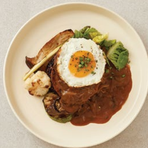
베러미트 함박 스테이크