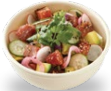
참치 포케 덮밥

칼로리 및 혈당 지수 조절에 도움을 주는 현미, 흑현미, 귀리, 퀴노아로 정성스럽게 지은 다이어트 밥을 사용합니다