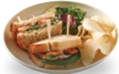
쉬림프 반미 샌드위치

V Shrimp Bahn Mi Sandwich 쉬림프 반미 샌드위치 452kcal