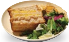
비건 그릴 치즈 샌드위치

혈당지수가 낮은 스펀트밀로 만든 천연 발효종 빵을 사용하여 다이어트 시 걱정 없이 드실 수 있으며, 밀가루 알러지가 있으신 분들도 안심하고 드실 수 있습니다