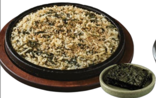
돌판 곤드레 무밥 Rice with Thistle and Radish on Stone Plate