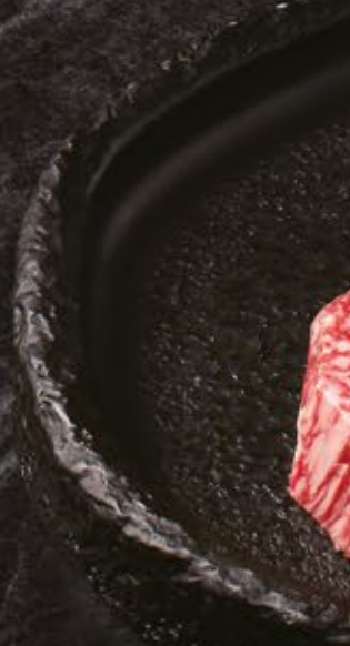
투블(BMS No.9) 숙성등심