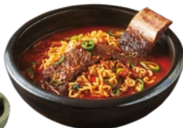
갈비 라면 Beef Short Rib Ramyeon