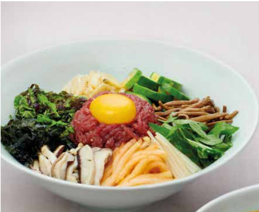
육회 비빔밥 Beef Tartare Bibimbap