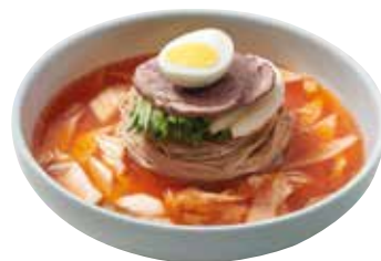
김치말이 냉면 20,000

Cold Buckwheat Noodle (Soup/Spicy/Warm) 水冷麵 / 混ぜ冷麵