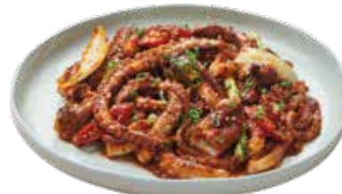
산낙지 볶음 (大) 75,000 (小) 35,000

Stir-fried Octopus テナガダコ炒め / 炒活长爪章鱼 * (小)는 런치에만 가능합니다.