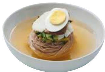
삼원 냉면 (물/비빔/온) 19,000

Cold Buckwheat Noodle (Soup/Spicy/Warm) 水冷麵 / 混ぜ冷麵