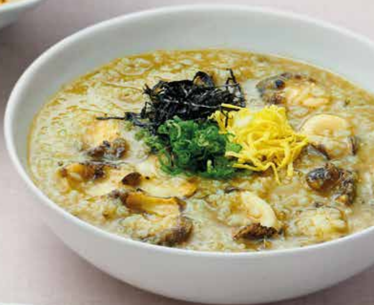
전복죽 Abalone Porridge