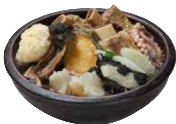
보양 갈비탕 40,000

Nutritious Short Rib Soup 栄養カルビタン / 营养牛排骨汤