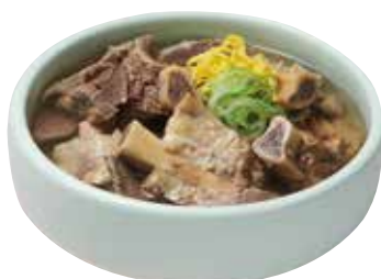
삼원 갈비탕 20,000 / (특) 26,000

Cold Buckwheat Noodle with Kimchi 김치入り冷やし混ぜそば / 辛奇汤面