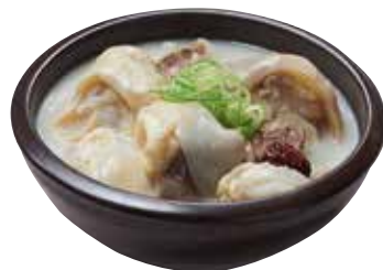
도가니 우족탕 40,000

Nutritious Short Rib Soup 栄養カルビタン / 营养牛排骨汤