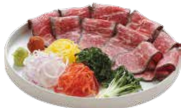
한우 로스 편채 55,000

Sliced Korean Beef with Vegetables 薄切り牛ロース焼き / 烤牛肉片佐菜丝