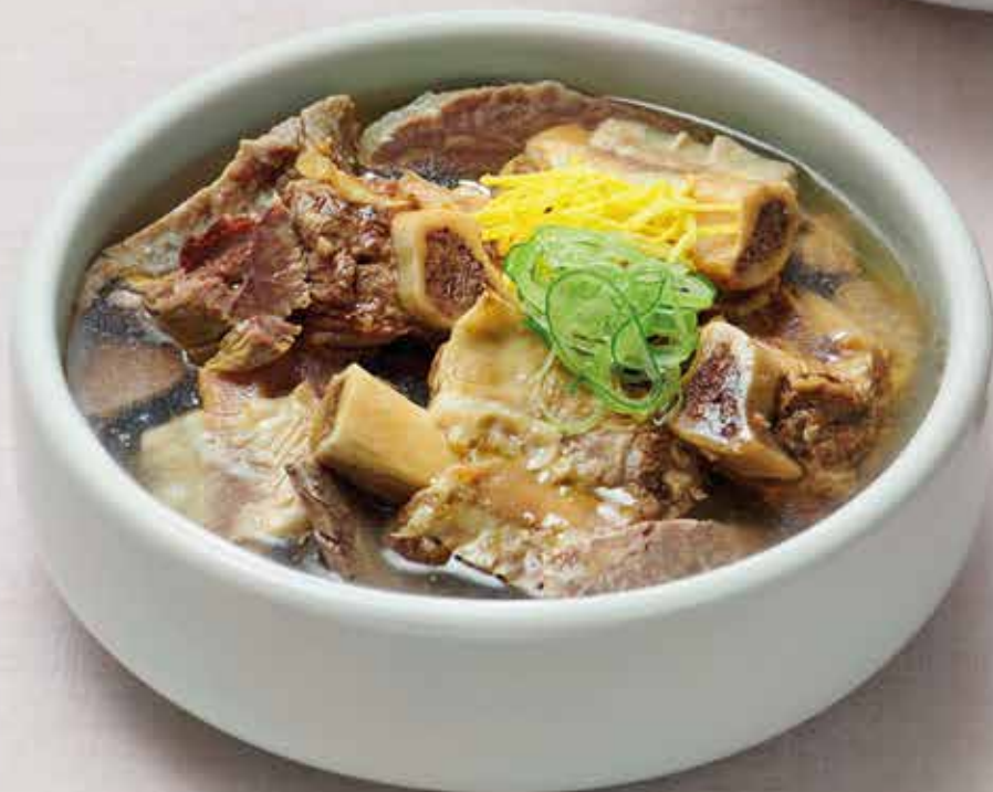
삼원 갈비탕 Short Rib Soup