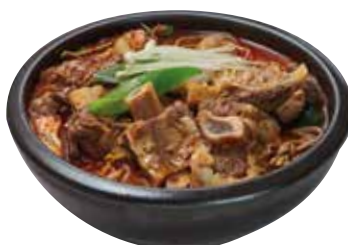
육개장 갈비탕 21,000