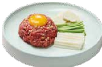
한우 육회 45,000

Sliced Korean Beef with Vegetables 薄切り牛ロース焼き / 烤牛肉片佐菜丝